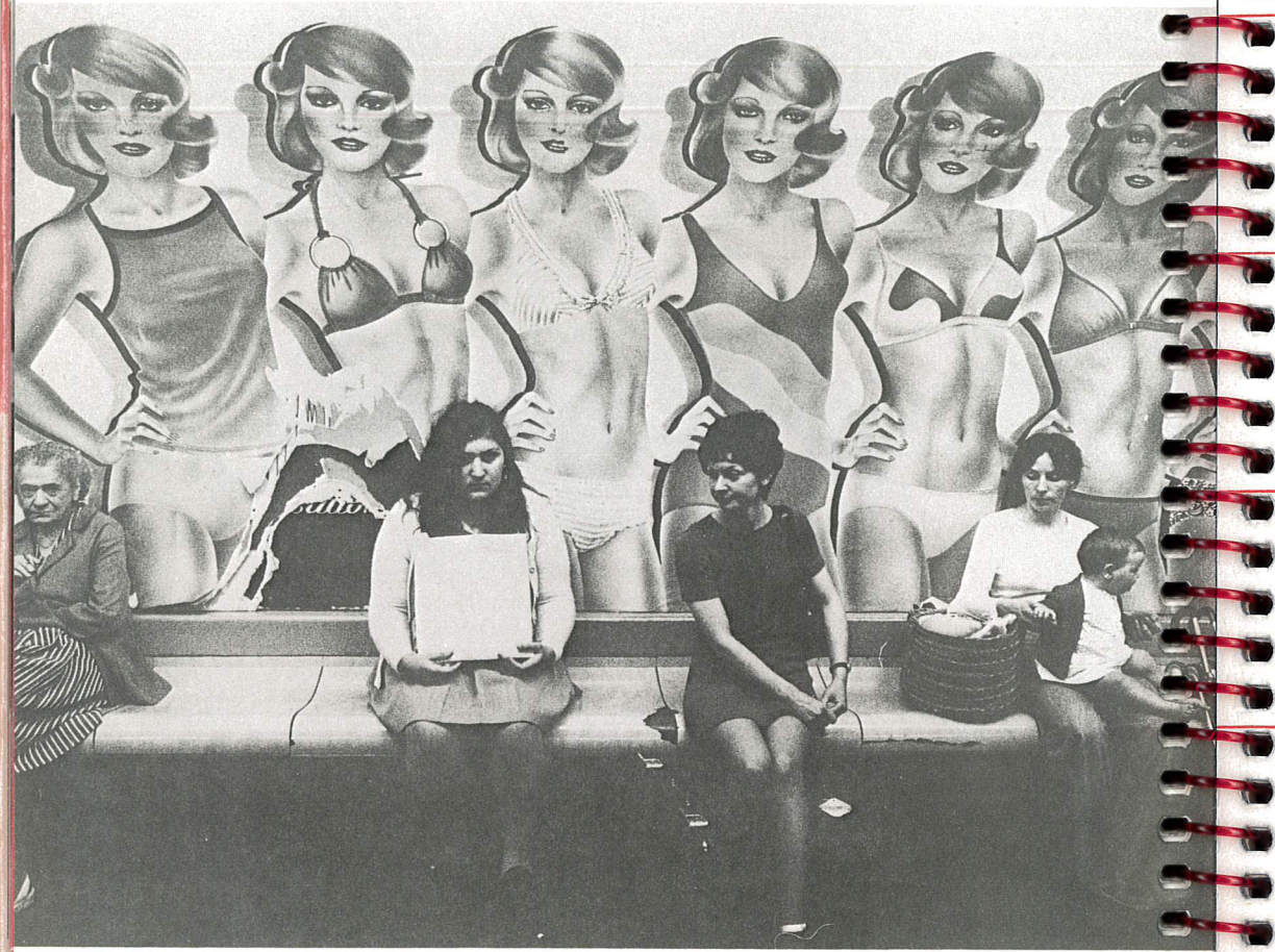
Das Bild der Frau in der Werbung konfrontiert mit alltäglicher Wirklichkeit.